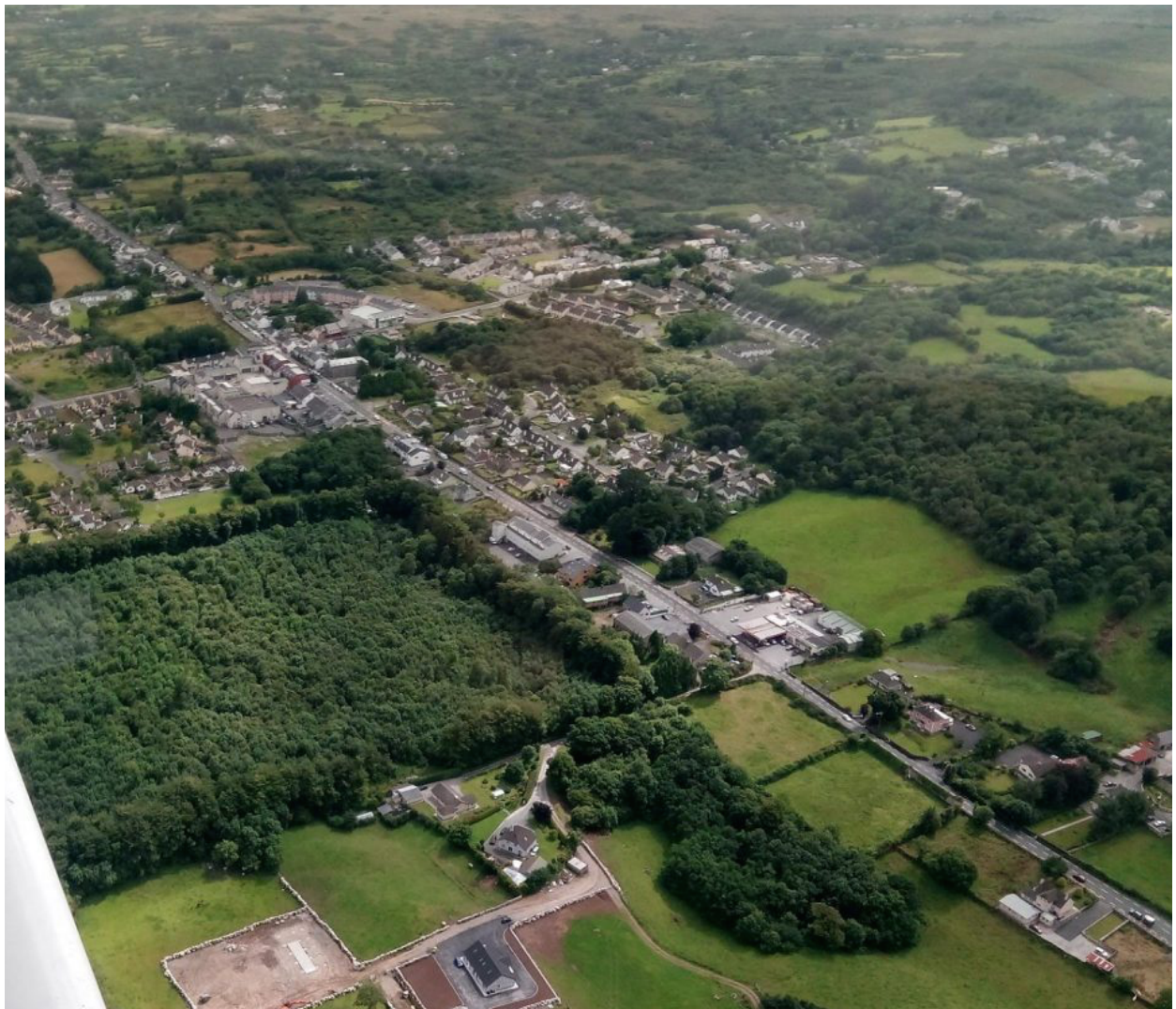
Maigh Cuilinn ón aer ón taobh ó thuaidh ag breathnú soir ó dheas.

Tábla a 6: Caiteachas Údarás na Gaeltachta ar thograí fostaíochta i Maigh Cuilinn 2008-2017..