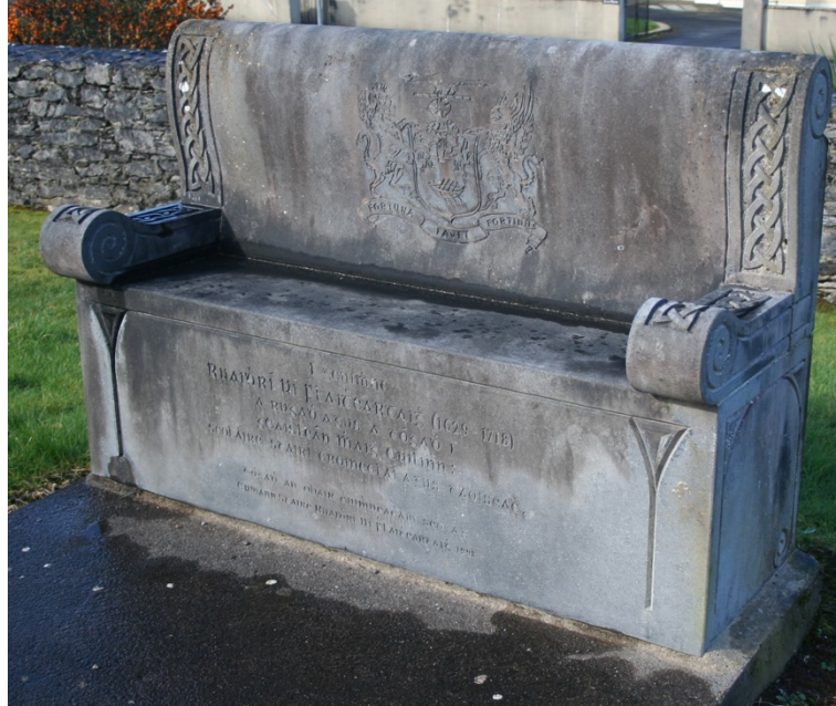
Suíochán in Omós do Ruaidhrí Ó Flaitheartaigh