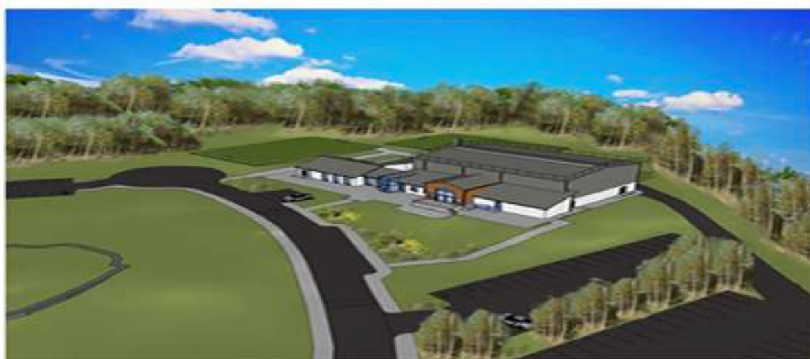
RADHARC THOIR THEAS ŌN AER

Ar an láimh ei le, thug duine amháin le fios nár mhór bheith an-réalaíoch tríd an abairt seo a scríobh - "(it will) be difficult ..... to go heavily Irish."