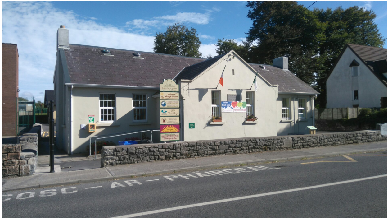
Áras Uilinn i Maigh Cuilinn mar a bhfuil an Naíonra, FPMC agus go leor eile suite

Ó thaobh maoiniú ón RCOG agus ÚnaG, caitheadh gar do €1M sa cheantar thar tréimhse deich mbliana agus sin le FPMC san áireamh. Chuaigh maoiniú RCOG chuig ceithre thogra a bhí bainteach go mór leis an nGaeilge (freastalaíonn an dá ghrúpa spóirt ar cheantair Ghaeltachta Catagóir A ina gcuid imeachtaí). Cé go raibh laghdú mór tagtha ar mhaoiniú ÚnaG do thograí fostaíochta ó 2011 ar aghaidh bhí ardú suntasach ann i 2017 agus ceithre thogra nua á maoiniú. Cuid de na tograí seo le deich mbliana anuas is tionscnaimh iad a bhaineann leis an turasóireacht agus bheadh sé cuí polasaí teanga a bheith acu le gné na Gaeilge a fhorbairt leis na cuairteoirí go háirithe gasúir scoile áitiúla.