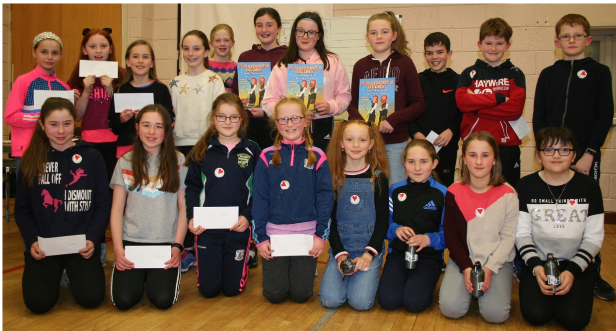
Buaiteoirí Thráth na gCeist Sheachtain na Gaeilge

Go socheacnamúil tá an ceantar i bhfad níos fearr as ná an chuid eile de Ghaeltacht na Gaillimhe. Tá caighdeán ard oideachais ar na daoine, tá fostaíocht forleathan agus rátaí ísle drochshláinte agus míbhuntáiste ann. Cé go n-oibríonn mórchuid den phobal i nGaillimh níl aon mhór-éileamh ar fhostaíocht an-mhór a chruthú sa limistéar. Bruachbhaile de Ghaillimh é i roinnt slite (fiú imríonn an fhoireann cispheile áitiúil in OÉG) agus dá bhrí sin suim ar leith sa cheantar i bPlean Teanga Bhaile Seirbhíse Gaeltachta chathair na Gaillimhe.