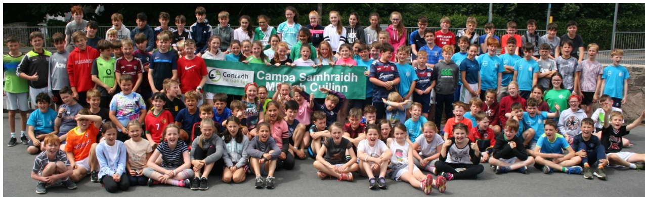
Páistí ag Campa Samhraidh Mhaigh Cuilinn 2018