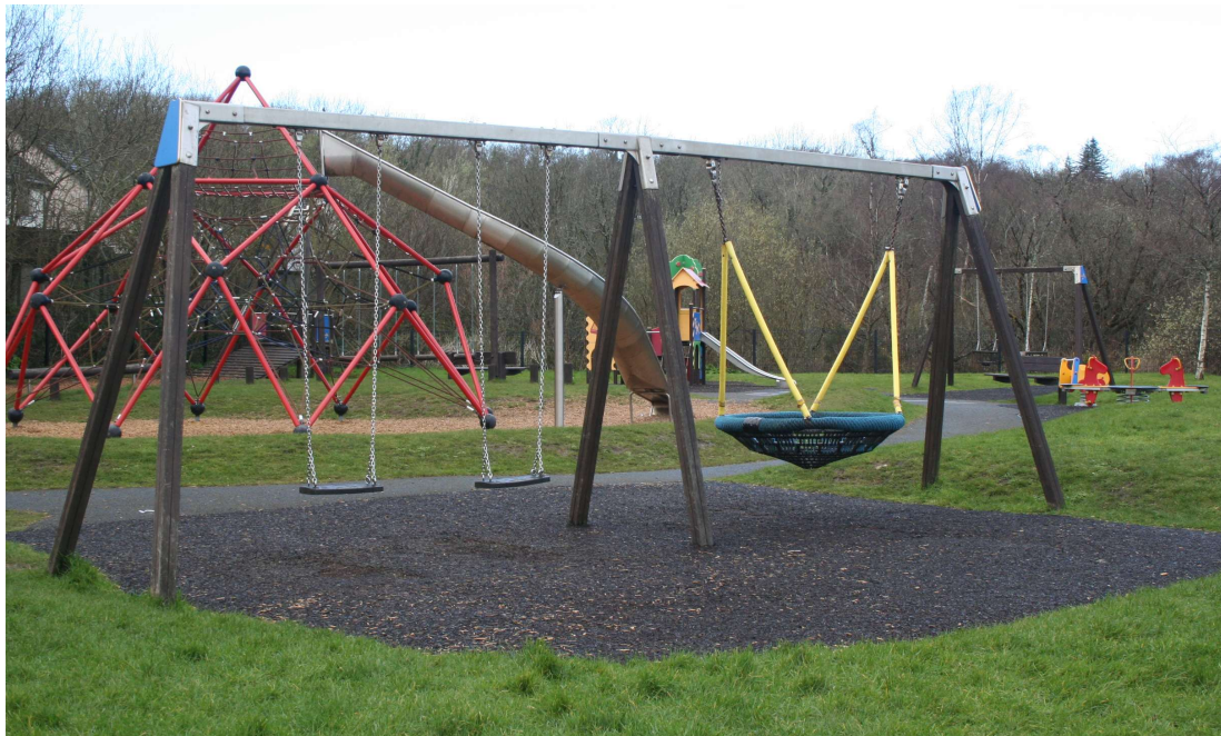
Páirc Spraoi Mhaigh Cuilinn