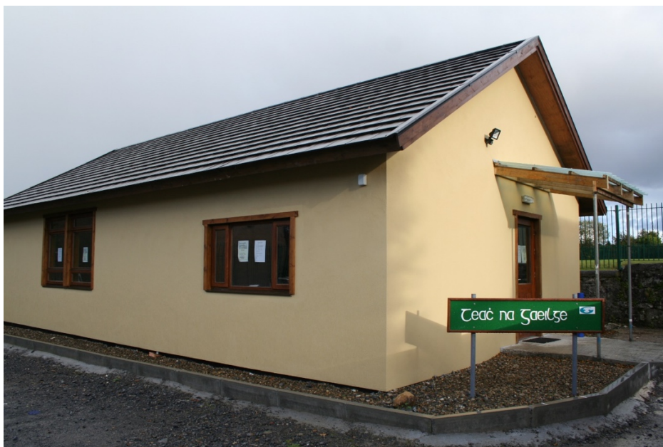
Teach na Gaeilge i Maigh Cuilinn